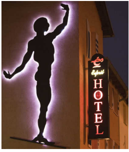
Objekt ID: 121057